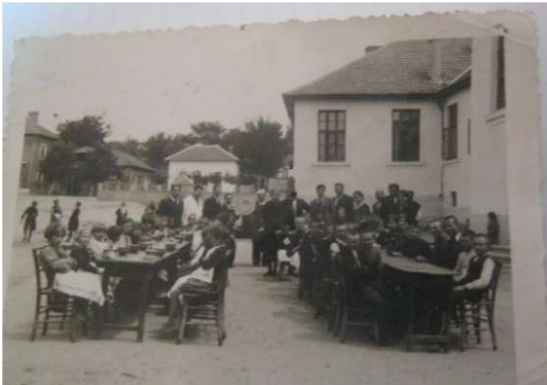
Столова за бедни деца в двора на училището през 1930-те години