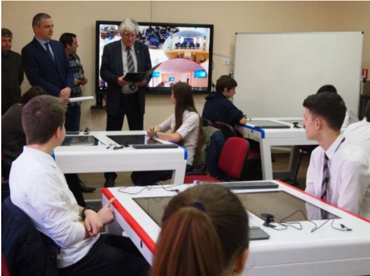
Откриване на Дигитална класна стая, 2021